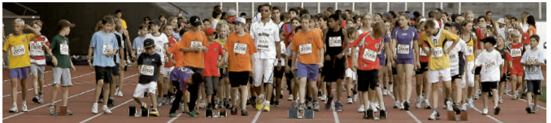
Die Schweizer Sportvereine brauchen 300 000 Ehrenamtliche